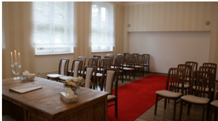
Trauzimmer der Gemeinde