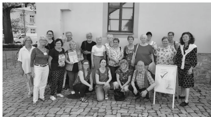
Teilnehmer*innen des ersten Treffens am 17. Juni 2022.

Am 17. Juni 2022 trafen sich über zwanzig Bürger*innen des Saalekreises im evangelischen Gemeindehaus in Bad Lauchstädt und beschlossen die Gründung einer Initiative von Leselernhelfer*innen, die mittlerweile den Namen „MENTOR - Die Leselernhelfer Saalekreis“ trägt. Der Freundeskreis Literatur e.V. in Merseburg ist Trägerverein der Initiative. Die Leselernhelfer*innen sind zugleich unter dem Dach von MENTOR - Die Leselernhelfer Bundesverband e.V. ehrenamtlich tätig. Unsere MENTOR-Gruppe ist ein neues Mitglied in der Gemeinschaft bereits erfolgreicher und etablierter Angebote der Leseförderung im Saalekreis und in Halle.