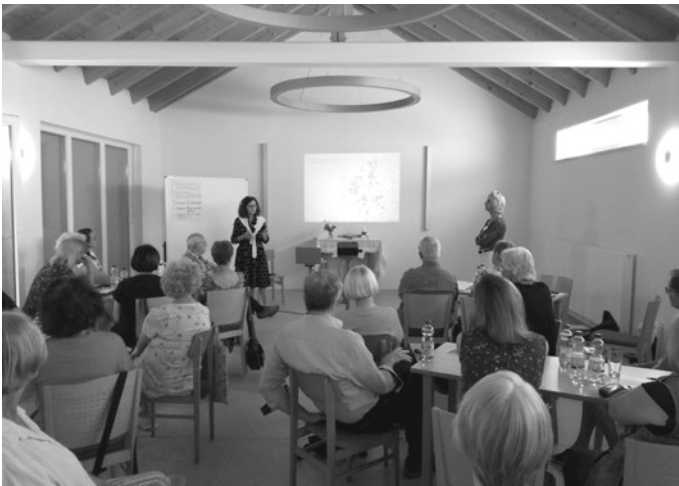
„Die Vorsitzenden des MENTOR Bundesverbandes stellen das 1:1-Konzept vor.“

Die Arbeit der Leselernhelfer*innen orientiert sich an dem 1:1-Prinzip von MENTOR. Ein*e Mentor*in liest mit einem Schulkind, einmal in der Woche, mindestens ein Jahr lang. In dieser Zeit stehen die Interessen und Fähigkeiten der Kinder, eine vertrauensvolle Beziehung und die Freude am Lesen in entspannter Atmosphäre im Vordergrund. Die Leseförderung erfolgt ausschließlich in Kooperation mit Schulen und in Schulen. Vorwiegend arbeiten wir mit Grundschulen zusammen, um Kindern frühzeitig beim Lesenlernen zu helfen.