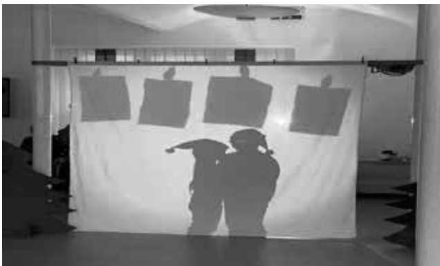
Die Hortgruppe „Erdmännchen“ C. Linge

So hatten die Kids noch einmal Höhepunkte und Erfolgserlebnisse zum Abschluss Ihres Projektes Schattenwelten.