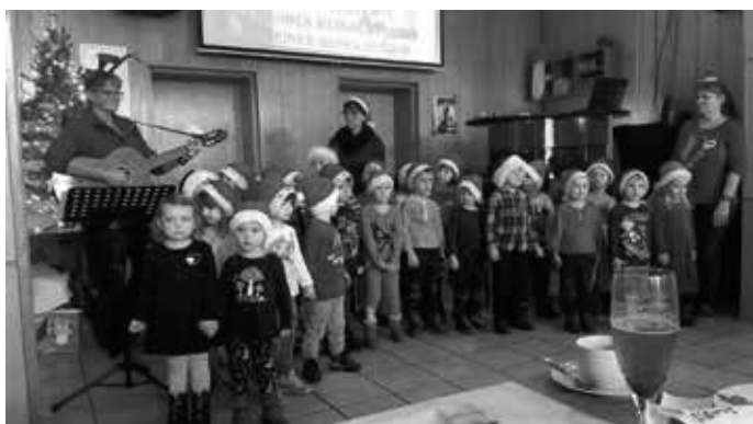
Die Kinder und Erzieher der Kita „Gestiefelter Kater“

Am 19.12.2019 fand dann wie jedes Jahr die Weihnachtsfeier für die Senioren in Zscherben statt. Die Kinder der Sonnen- und Käfergruppe zeigten wieder ein sehr schönes, weihnachtliches Programm, so dass nicht nur die Augen unserer Kinder leuchteten.