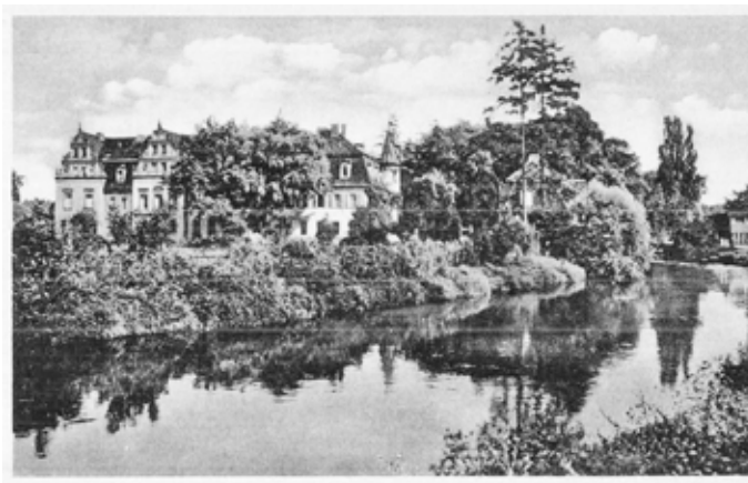
Ortschaft Holleben OT Benkendorf, Ansichtskarte vom Benkendorfer Schloss (Westseite), gel. 1944

Der in einem Bogen des Hollebener Mühlgraben gelegene Ortsteil wurde noch vor 1300 als „Panickendorf“ erwähnt. Die kleine Siedlung gehörte ab dem 15. Jahrhundert zum Klostergut des Merseburger Stifts. 1950 wurde das heute 232 Einwohner (Stand: 31. Dezember 2017) zählende Benkendorf nach Holleben eingemeindet.