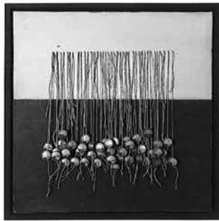
Dirk Braungardt db Collagen

Ausstellung Dirk Braungardt Db Collagen am 23.08.2017 - 19:30 Uhr