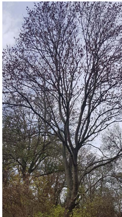
Abbildung 18: Baum ohne Horst 2022

Die Brutstätte des Milans ist nicht mehr vorhanden.