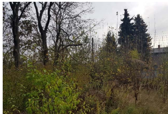
Abbildung 20: Aufwuchs von Gehölzen November 2022