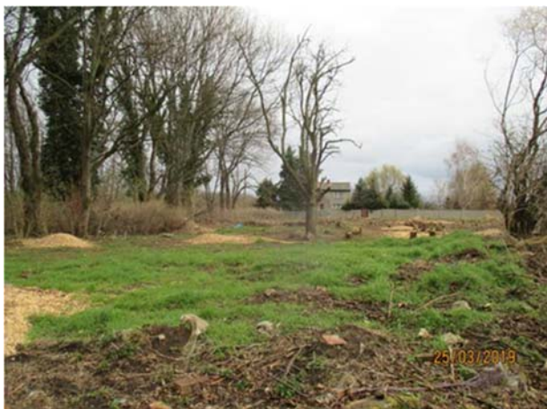
Abbildung 19: Abholzungen März 2019