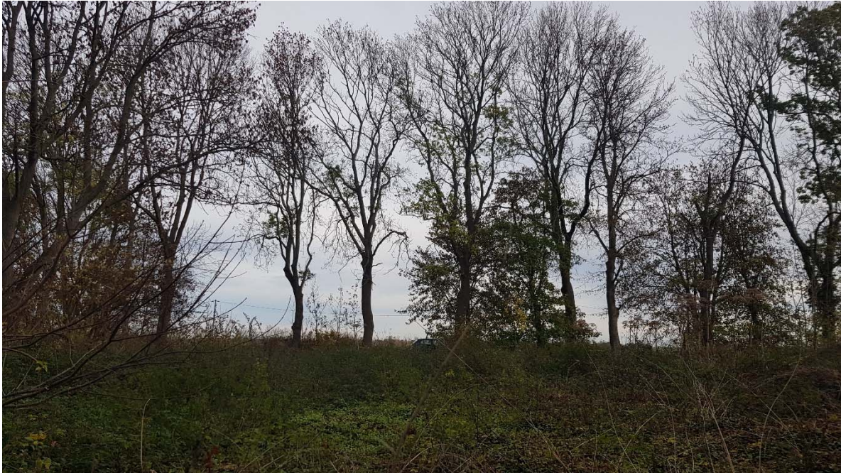
Abbildung 27: geschützte Baumreihe am Amselweg 2022

Die geschützten Baumreihen sind zu erhalten