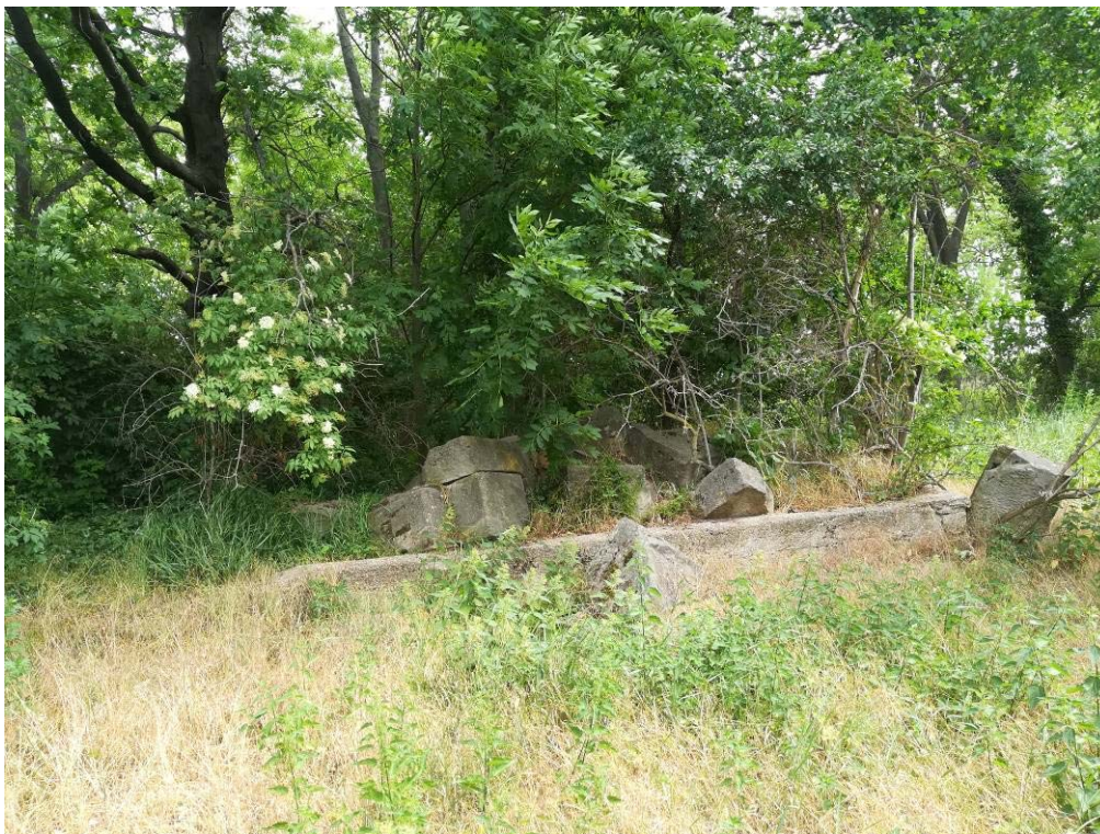
Abbildung 14: Reste von Einfriedungen

Desweiteren sind in diesem Bereich Reste von anthropogen angelegten Einfriedungen und Plätzen sichtbar.