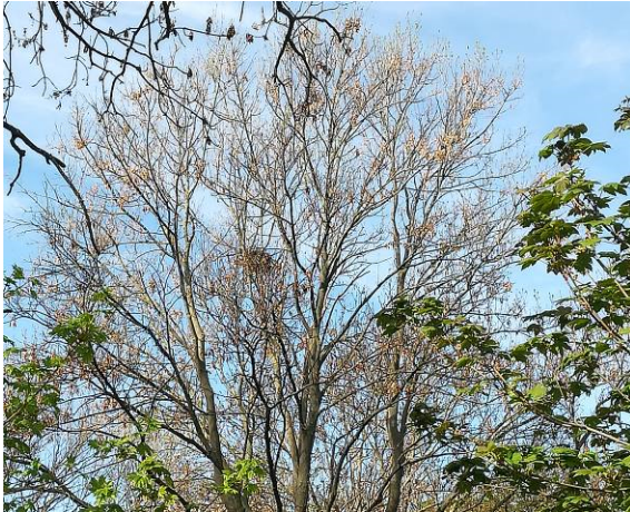
Abbildung 15: Horst im Untersuchungsgebiet

Im Untersuchungsgebiet konnte ein Horst festgestellt werden