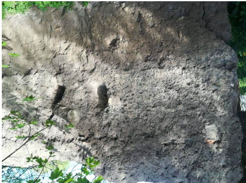
Abbildung 16: Lehmmauer

Ein Vorkommen von streng geschützten holzbewohnenden Käferarten ist nicht auszuschließen, jedoch befinden sich im Untersuchungsgebiet nur sehr geringe Mengen an Totholz. Streng geschützte Schmetterlings- und Libellenarten sind im Plangebiet nicht zu erwarten, da keine lebensraumtypischen Strukturen und Nahrungspflanzen vorkommen. Die Lehmmauer ist ein potentieller Lebensraum für verschieden Insektenarten und muss erhalten bleiben.