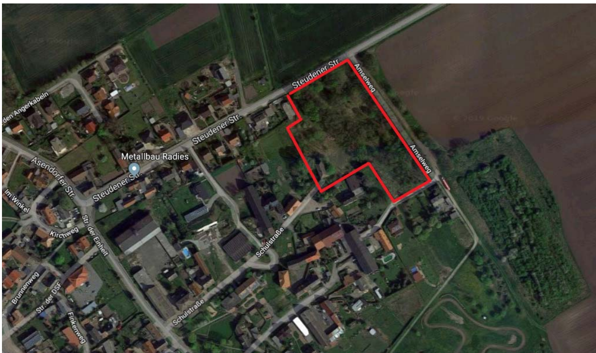
Abbildung 1: Gemeinde Teutschenthal OT Dornstedt Lage in der Ortschaft