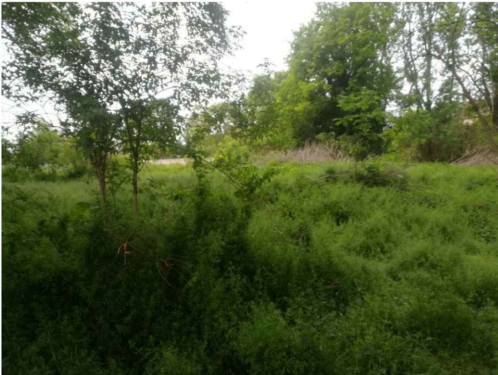
Abbildung 6: Krautschicht nordöstlicher Bereich, Foto planerzirkel, Mai 2019

Als sichtbare Abgrenzung zwischen den nordöstlichen und südwestlichen Bereichen dienen eine Baumreihe und eine Lehm-mauer.