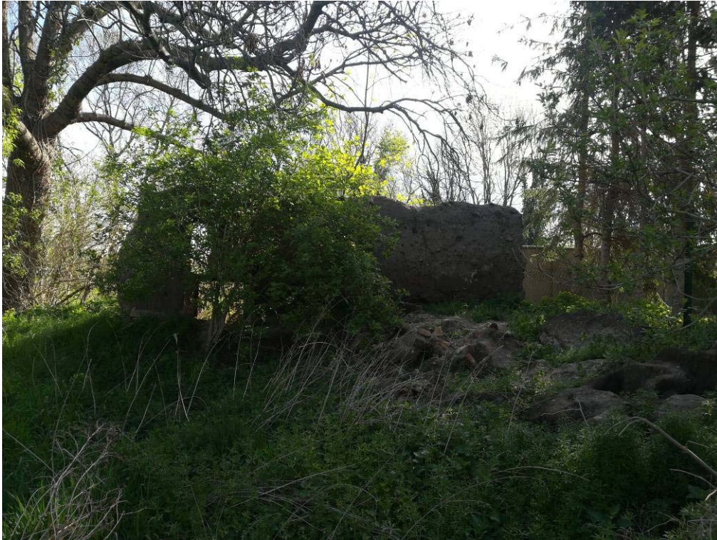
Abbildung 7: Lehmmauer, Foto planerzirkel