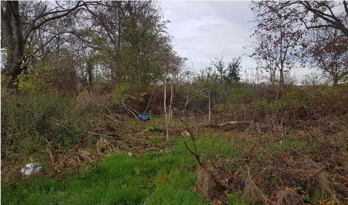
Abbildung 23: Ablagerung von Müll im Untersuchungsgebiet 2022