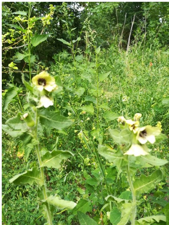
Abbildung 10: Krautflur südöstlicher Bereich, Foto planerzirkel

Dieser südwestliche Geltungsbereich liegt seit vielen Jahren brach, im ehemaligen gepflasterten Hofbereich vor dem Gebäude hat sich eine Gras- und Krautflur durchgesetzt, der umliegende Bereich weist noch auf den ehemals angelegten Garten durch Staudenpflanzungen hin. Dominiert wird dieser nun durch Ruderalflur, besonders Brennnessel, Acker-Kratzdistel, und Gräsern. Desweiteren hat sich in einem Bereich Bilsenkraut etabliert.