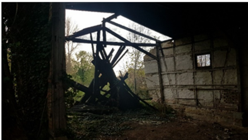
Abbildung 25: Lagerschuppen 2022

Der ehemalige Lagerschuppen droht komplett einzustürzen. Kontrolle des Vorkommens von schützenswerten Arten ist vor Beginn der Baumaßnahme durchzuführen.