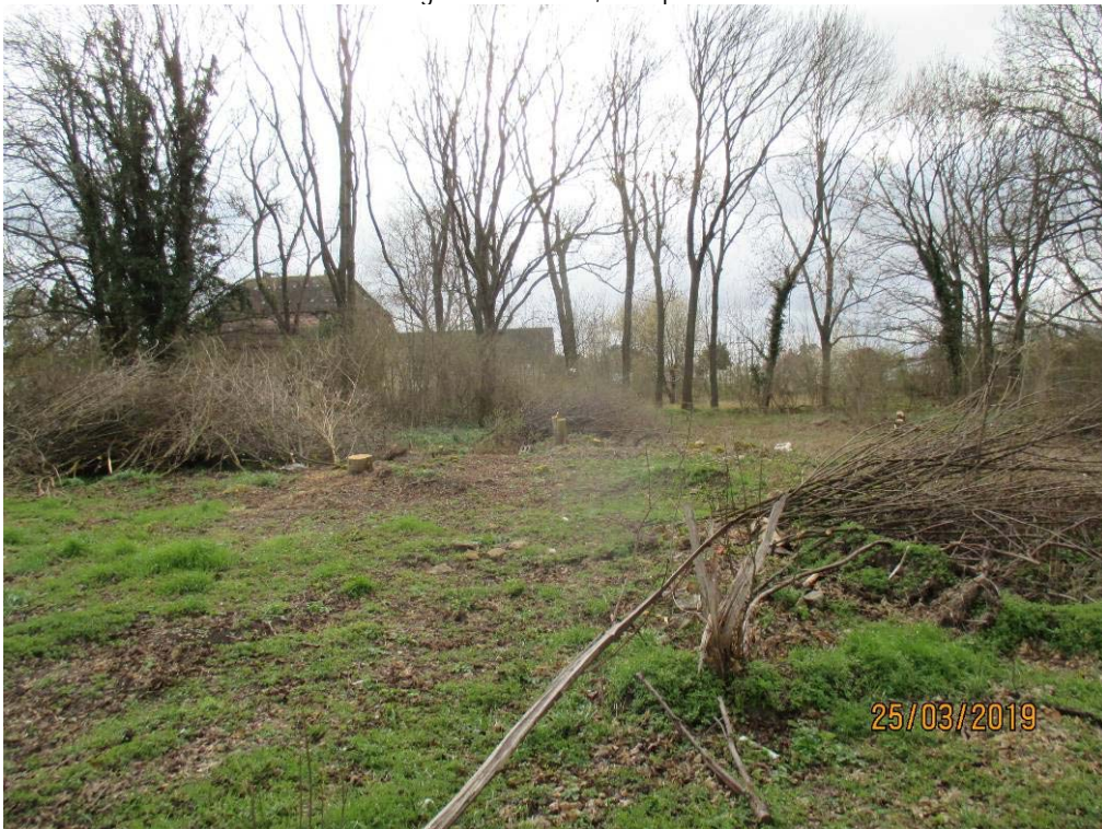
Abbildung 8: Baumreihe im Untersuchungsgebiet