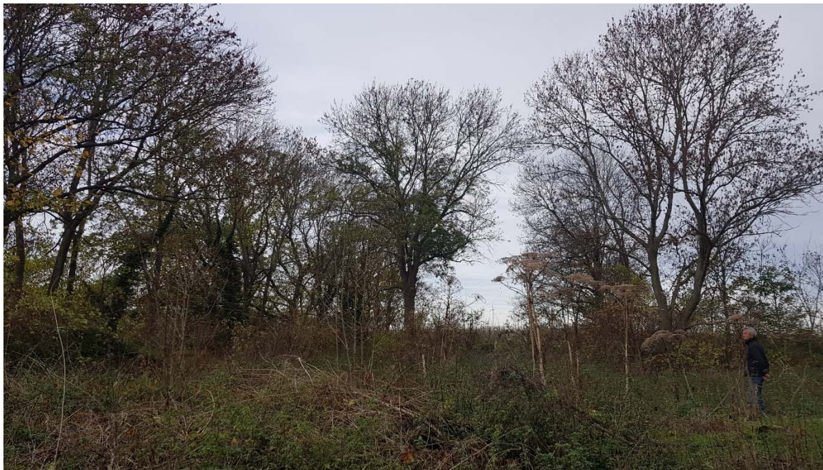
Abbildung 21: Aufwuchs von Riesenbärenklau 2022

Im gesamten Untersuchungsgebiet ist ein starker Aufwuchs von Gehölzen (besonders Ahorn), auf den ehemaligen abgeholzten Flächen, und von Riesenbärenklau, auf den offenen Krautflächen im Gebiet, zu verzeichnen. Weiterhin wird das Untersuchungsgebiet zur Entsorgung von Müll benutzt.