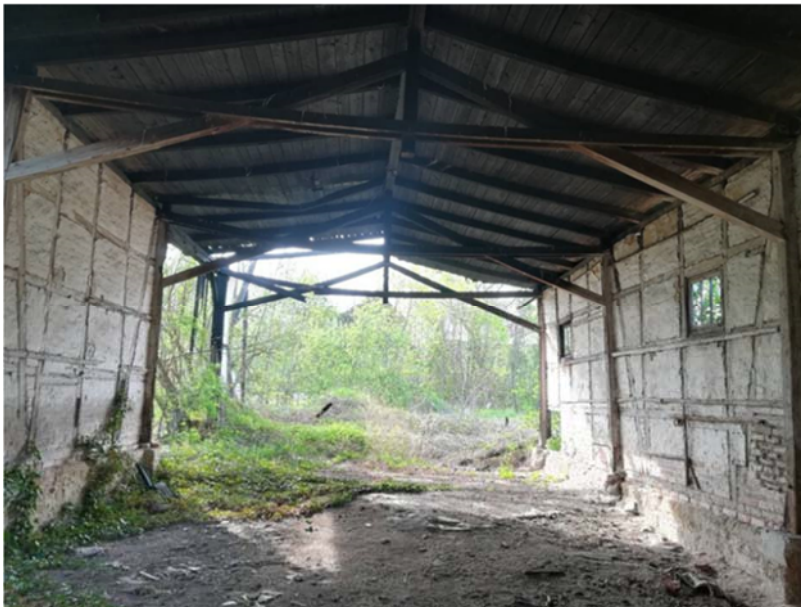
Abbildung 24: Lagerschuppen 2019