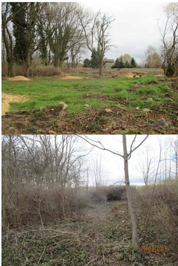
Abbildung 3 und 4: Abholzungen, Foto planerzirkel, März 2019

Vor den Fällungen war dieser Bereich mit Bäumen, wie Pappeln, Ahorn, Eschenaufwuchs etc. und Sträuchern, wie Holunder, Hartriegel, Rosengewächsen, dicht bewachsen. Im inneren Teil des nordöstlichen Gebietes gab und gibt es einen offenen Teil, der vorherrschend mit Riesenbärenklau bewachsen ist. Die Krautschicht besteht vorwiegend aus Ruderalpflanzen wie Brennnessel, Giersch, Brombeere, silberblättrige Taubnessel, Klettenlabkraut, Acker Hellerkraut und Gräsern.