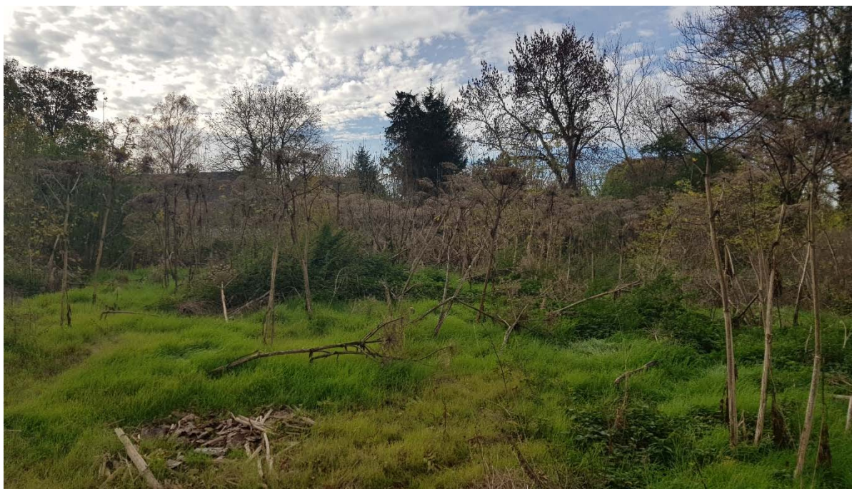
Abbildung 22: Aufwuchs von Riesenbärenklau 2022