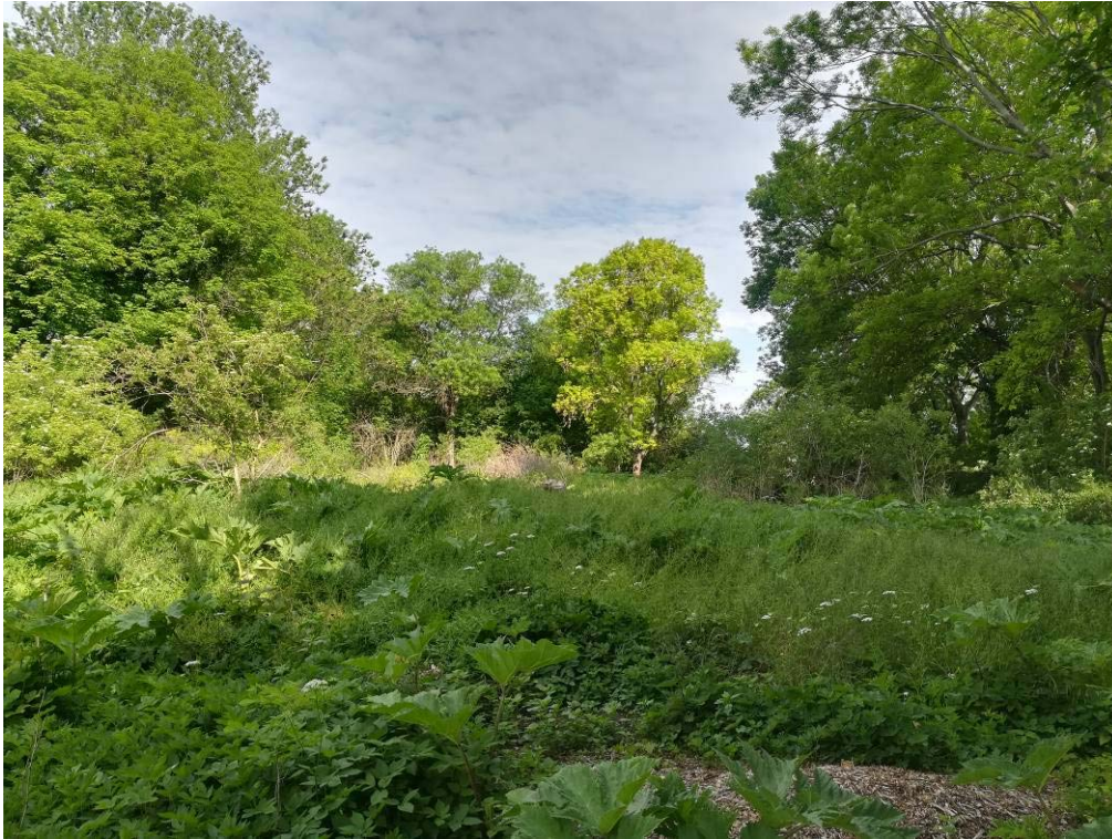
Abbildung 5: Krautschicht nordöstlicher Bereich, Foto planerzirkel, Mai 2019