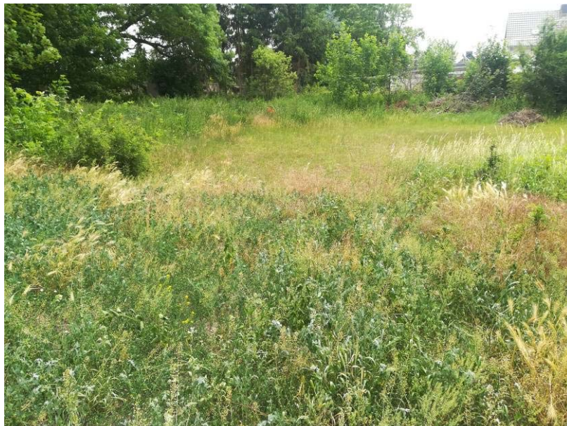
Abbildung 11: Krautflur südöstlicher Bereich

Westlich des Gebäudes ist durch Ahornaufwuchs ein zusammenhängender Gehölzbereich entstanden.