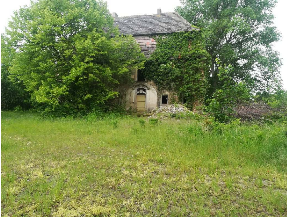
Abbildung 9: zweigeschossiges Gebäude, Foto planerzirkel

Im südwestlichen Bereich befindet sich ein denkmalgeschütztes, leerstehendes zweigeschossiges Gebäude.