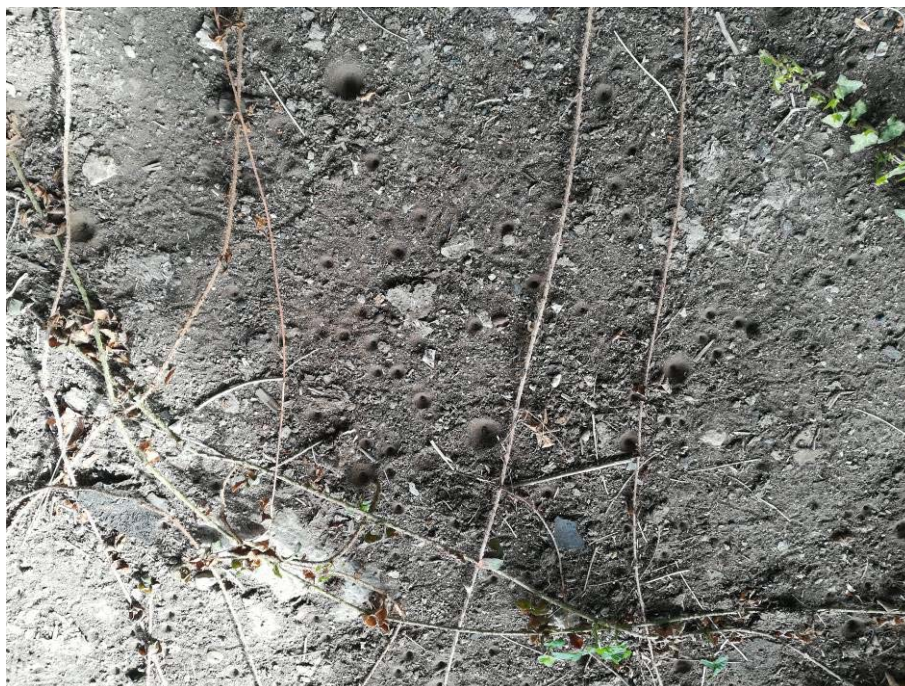
Abbildung 12: Trichter der Ameisenlöwen

In Richtung Steudener Straße befindet sich ein alter, zerfallener Lagerschuppen unter dessen morschem Dach sich Ameisenlöwen angesiedelt haben.