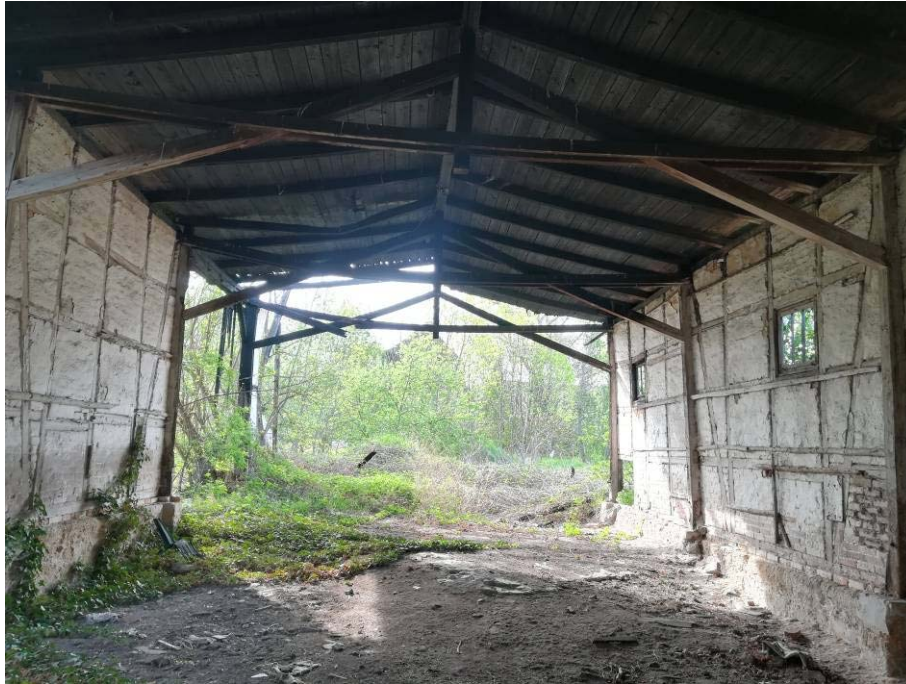
Abbildung 13: Lagerschuppen

Desweiteren sind in diesem Bereich Reste von anthropogen angelegten Einfriedungen und Plätzen sichtbar.