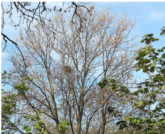
Abbildung 17: Baum mit Horst 2019