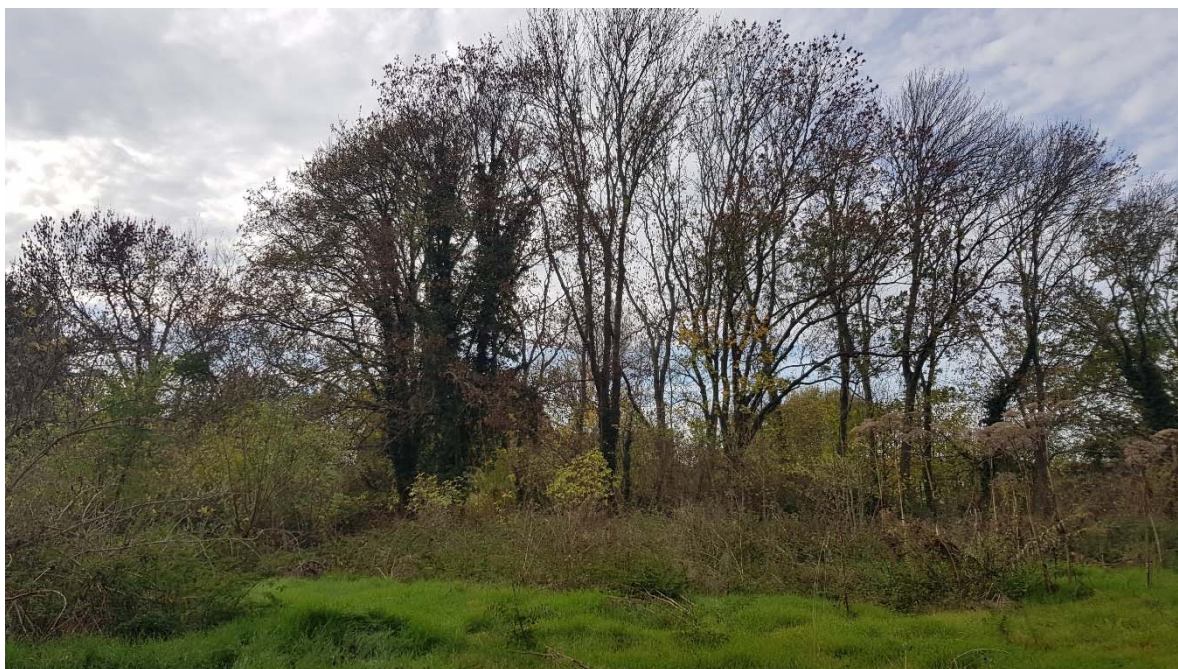
Abbildung 26: geschützte Baumreihe im Untersuchungsgebiet 2022