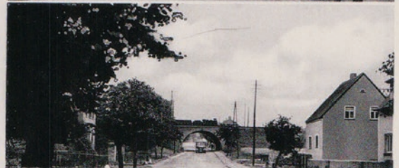
Gruß aus Schlettau