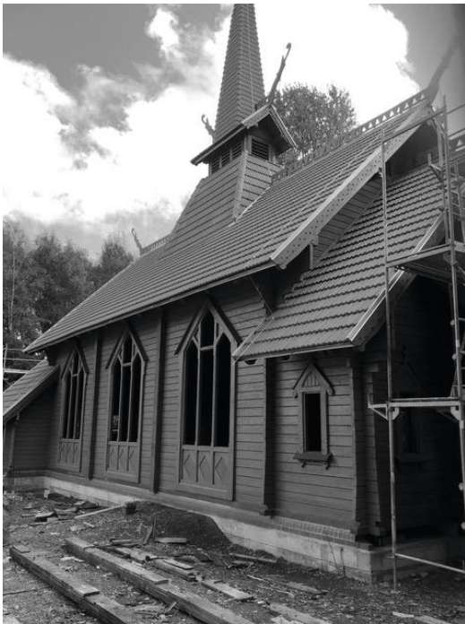
Stiftkirche in Stiege

Ein paar Biere und Schierker Feuerstein hatten wir uns verdient, mit dem Erfolg zufrieden ins Bett zu sinken. Am nächsten Morgen, gut erholt, machten wir uns zur dritten Etappe auf. Über Güntersberge führte die Route nach Trautenstein. In Stiege mußten wir unbedingt die Stabkirche besuchen. Anfang diesen Jahres wurde sie umgesetzt vom Albrechtshaus nach Stiege. Das war nötig, um die historische einmalige Stabkirche vor der weiteren Zerstörung zu schützen.