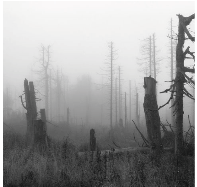
Kahle Bäume auf dem Brocken

Nun waren wir schon in höheren Lagen des Harzes angekommen, das Landschaftsbild änderte sich erheblich, leider recht negativ. Auf großen Flächen ragten abgestorbene Bäume gen Himmel, sie sahen aus wie lange Zeigefinger, die uns an ihr trauriges Schicksal hinweisen wollten. Es war erschütternd. 15 Jahre lang sind wir jedes Jahr im Harz gewesen und können uns ein Bild machen. Erschreckend wie schnell das Baumsterben voran geschritten ist. Große Flächen lagen kahl vor uns, ein nie da gewesener Fernblick war die Folge. Brocken und Wurmberg, früher nicht zu sehen, zeigten sich am Horizont. Einerseits ist Fernsicht ja schön, aber der Preis dafür ist doch etwas zu hoch!