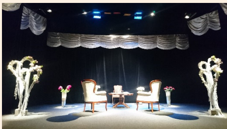
Teutsches Theater Teutschenthal