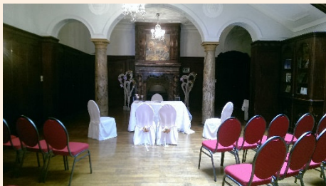
Kaminzimmer im Schloss