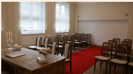
Trauzimmer der Gemeinde