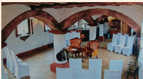
Kleiner Festsaal Gut Schlettau

In der Gemeinde Teutschenthal stehen Ihnen sechs Eheschließungsorte zur Auswahl: das Trauzimmer der Gemeindeverwaltung, das Schloss Teutschenthal, die Motocrossstrecke, seit 2017 das Teutsche Theater Teutschenthal und das Rittergut Etdorf sowie seit 2019 der kleine Festsaal auf dem Gut Schlettau im OT Angersdorf.